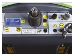
PANNELLO DI CONTROLLO INTUITIVO